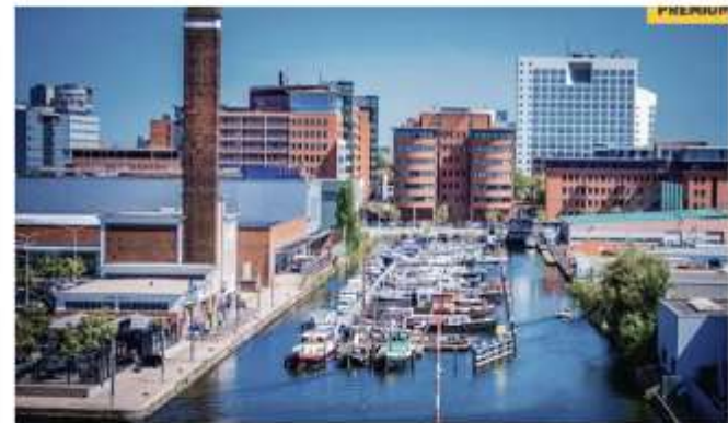
▲ De Binckhorst.